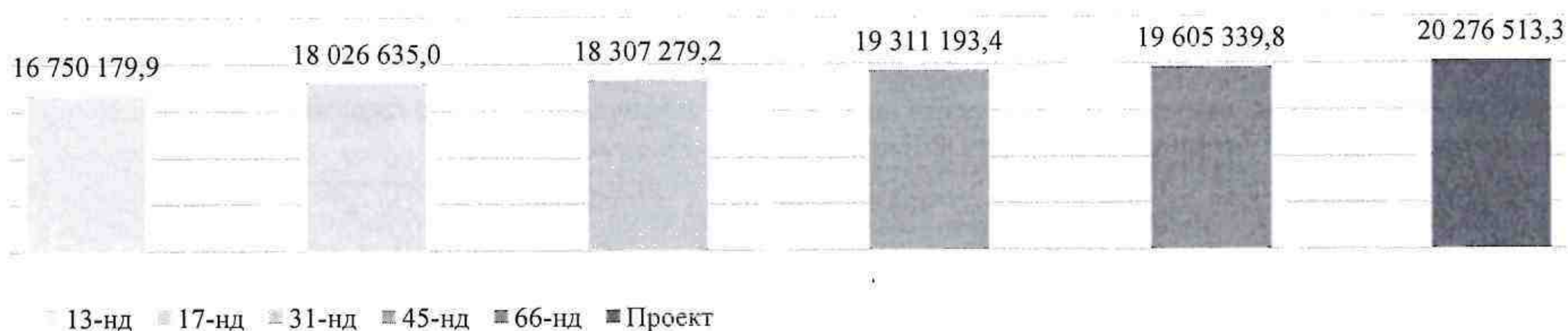
Сравнительная характеристика общего объема расходов бюджета городского округа в 2023 году (тыс. рублей)

Согласно представленному проекту решения, объем расходов на 2023 год увеличивается за счет средств: